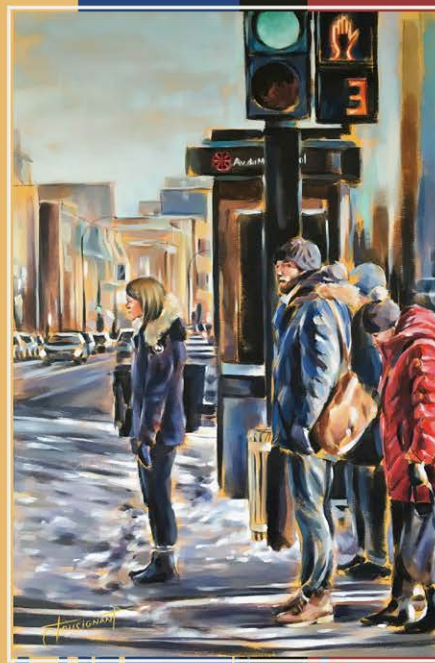
Trois fois passera (2020)

360, rue McGinnis (secteur Iberville) Saint-Jean-sur-Richelieu QC J2X 3E8