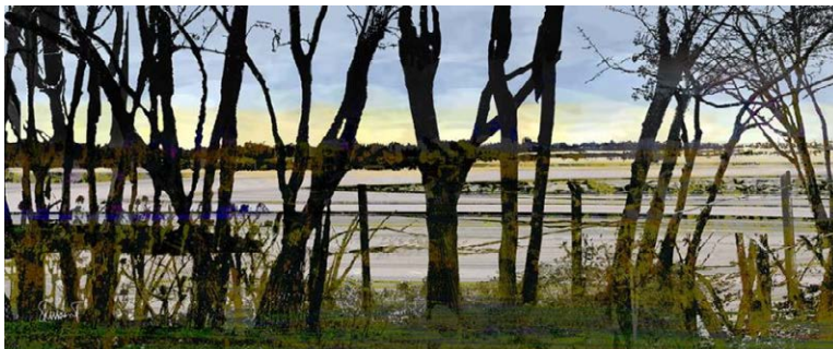
« Été à Boucherville ». Estampe numérique de Susan St-Laurent imprimée au Zocalo.

Pour créer, l'artiste utilise couramment l'ordinateur, la tablette numérique et la peinture à l'acrylique, ce qui exige de maintenir un niveau constant d'apprentissage et d'expérimentation.