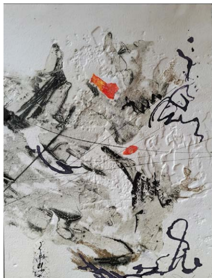
Expressif, 11x14 pouces, estampe

À proprement dit, une estampe est le résultat de l'impression d'une gravure. Cette dernière est réalisée grâce à des incisions et du creusage effectués sur un bloc (bois, métal, pâte à modeler, plexiglass, etc). Une fois terminée, cette matrice est enduite d'encre ou de peinture et