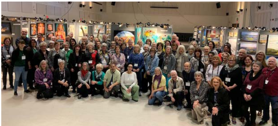
Artistes participants Expo Galerie 2024

L'Expo-Galerie de l'Association des artistes peintres affiliés de la Rive-Sud (AAPARS) qui a eu lieu au centre multifonctionnel Francine Gadbois, à Boucherville, les 6 et 7 avril a été un franc succès. Près de 1100 personnes y sont passées pour admirer les magnifiques œuvres des 80 exposants.